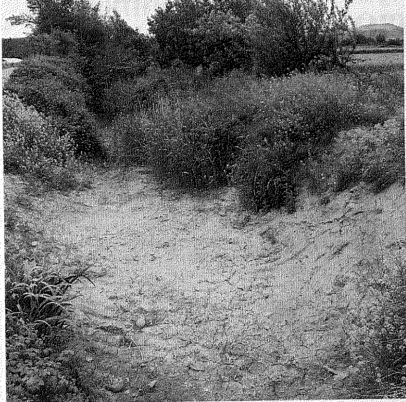
Estado que presentaba el Canal de Miranda el pasado 19 de mayo, totalmente seco.