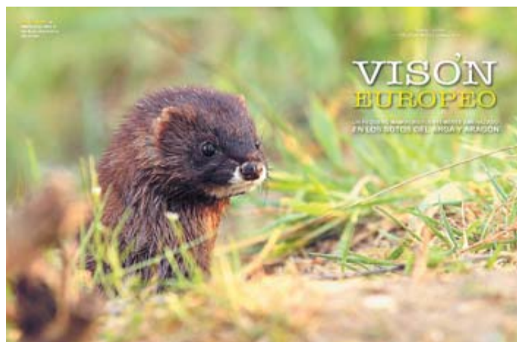
El visón europeo habita en los sotos de los ríos Arga y Aragón.

Alsasua, Bakaiku, Iturmendi, Olazti, Urdiain y Ziordia forman, en la frontera con Álava, el histórico valle de Burunda. En su portada de primavera, Conocer Navarra propone un recorrido por estos seis pueblos unidos por un pasado común, y que geográficamente dan cierre al inmenso corredor de Sakana por el oeste. Burunda es un valle tres veces rico: por su naturaleza—está custodiado por dos parques naturales como las sierras de Aralar y Urbasa-Andía—; por su historia (desde el megalitismo a la ruta jacobea) y, sobre todo, por haber conservado un sinfín de tradiciones y bellas muestras etnográficas. La siguiente propuesta de este número tiene como protagonista al visón europeo, un pequeño mamífero fuertemente